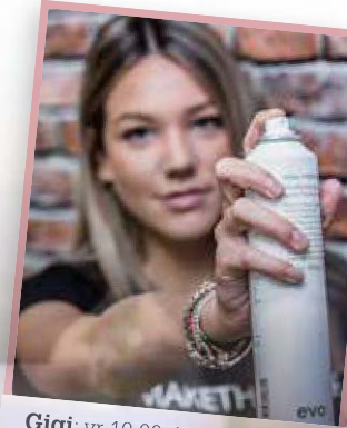
Gigi: vr 10:00-18:00 en za 09:00-15:00

Kleuren behoort tot een van onze specialiteiten. Overigens hebben wij onze klanten nog meer te bieden: we verzorgen namelijk eveneens de visagie en kapsels van bijvoorbeeld bruidjes. Wij vinden het belangrijk dat het gevoel van een klant goed is. Dat maakt dat hij of zij vaker terugkomt. Wij doen er dan ook alles aan om het onze klanten naar de zin te maken, zodat ze niet alleen met een mooie nieuwe coupe, maar ook met een goed gevoel de deur weer uit lopen. Dit doen we door een relaxte, huiselijke sfeer te creëren. Om het zo makkelijk mogelijk te maken, zijn wij drie avonden in de week open, op woensdag, donderdag en vrijdag. Voor de actuele openingstijden kun je terecht op onze website www.haironthefloor.nl of op de Facebook/Instagrampagina van Hair on the FLOOR.