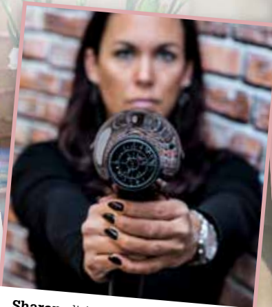
Sharon: di 10:00-17:45 en wo 10:00-18:15