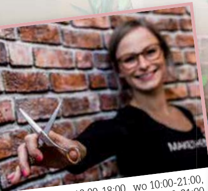
Floor: di 10:00-18:00, wo 10:00-21:00, do 10:00-18:00, vr 10:00-21:00 en za 09:00-15:00