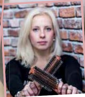
Sabine: wo 18:00-21:00, do 10:00-21:00, vr 10:00-20:00 en za 09:00-15:00